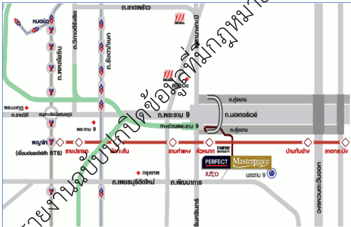
รูปที่ 1-1 ที่ตั้งโครงการโดยสังเขป

เส้นทางการคมนาคมเข้าสู่พื้นที่โครงการ จะใช้การคมนาคมทางบกโดยอาศัยรถยนต์ ซึ่งทางเข้า-ออกโครงการจะเข้าออกได้ทั้งจากถนนมอเตอร์เวย์ และ ถนนพัฒนาการ ใกล้ทางด่วนพระราม 9 (รูปที่ 1-1)